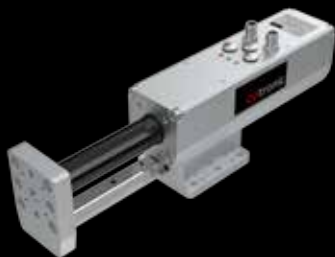
Elektrický válec CTC-F