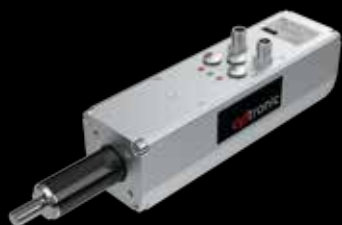
Elektrický válec CTC