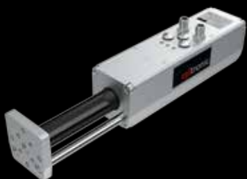
Elektrický válec CTC-V